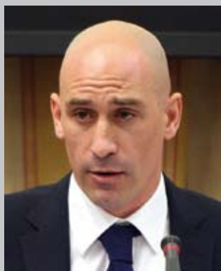
Luis Rubiales Presidente de la AFE