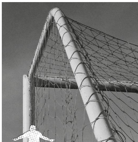
“Si ayudamos a una sola persona a tener esperanza, no habremos vivido en vano”. Martin Luther King