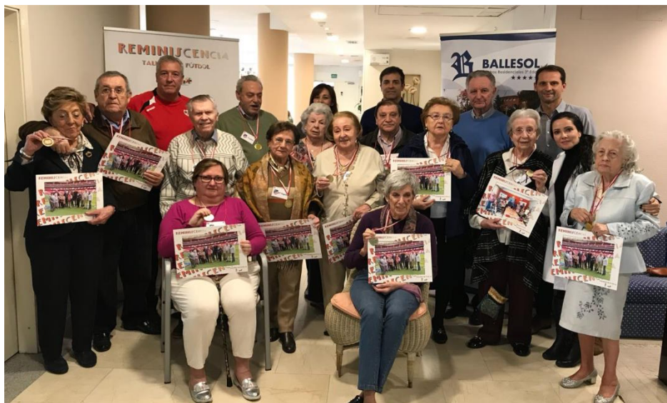
Redacción, 31 de diciembre 2017. Los seis Talleres de Fútbol ejecutados

durante el segundo semestre de 2017 vivieron las últimas sesiones en sus